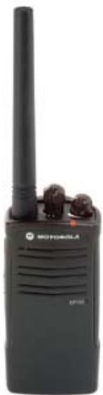
Modelo EP150 VHF

Com peso de apenas 243 gramas, o EP150 garante conforto o dia inteiro. E mais: a interface de usuário torna o rádio simples e fácil de usar com pouco ou nenhum treinamento.