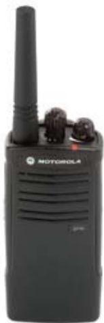
Modelo EP150 UHF

Projetado para atender às necessidades de gestão do setor de hospitalidade