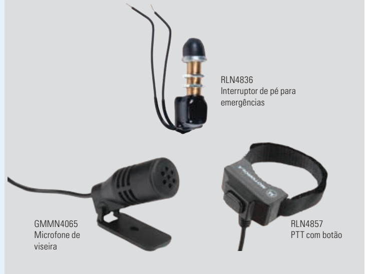
RLN4836 Interruptor de pé para emergências