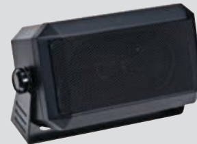
RSN4001 Alto-falante externo de 13W