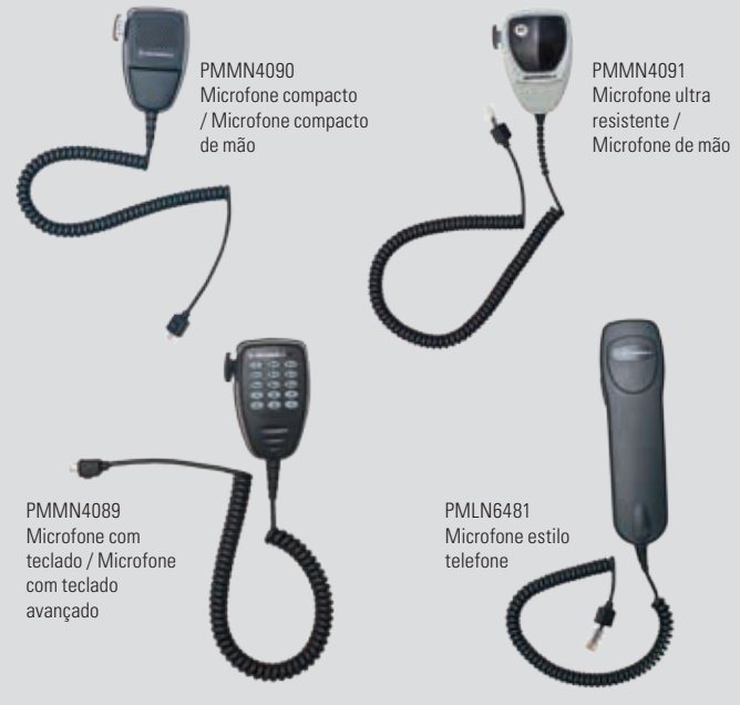
PMMN4090 Microfone compacto / Microfone compacto de mão